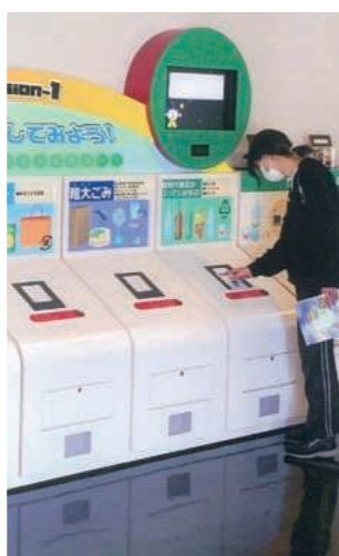
▲分別はしっかりできました。

10月16日(日)、生活学級で網干のエコパークを見学しました。改めて持ち込まれるごみの多さに驚き、市民の心がけが大切だと感じました。