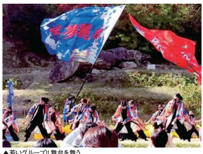
▲若いグループ!! 舞台を舞う