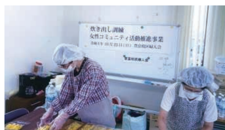
▲アルファ化米完成!

10月23日(日)、校区あげての豊富まつりに婦人会も参加し女性コミュニティ活動推進事業として、アルファ化米を作りマスク・水といっしょに配布しました。3年ぶりの豊富まつりは大盛況で終わりました。 (上野裕美)