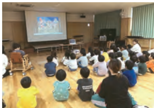
トすると、嬉しそうに話してくれました。(河南 眞稚子)

ビデオをプロジェクターで映しながら、紙芝居や絵本も見ながら行ったので、興味を持って見てくれました。