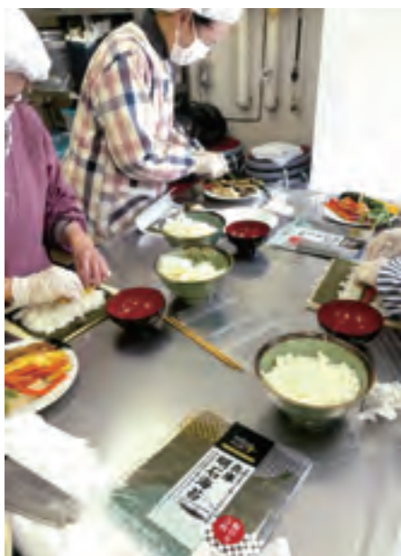
▲みんな上手に巻いています