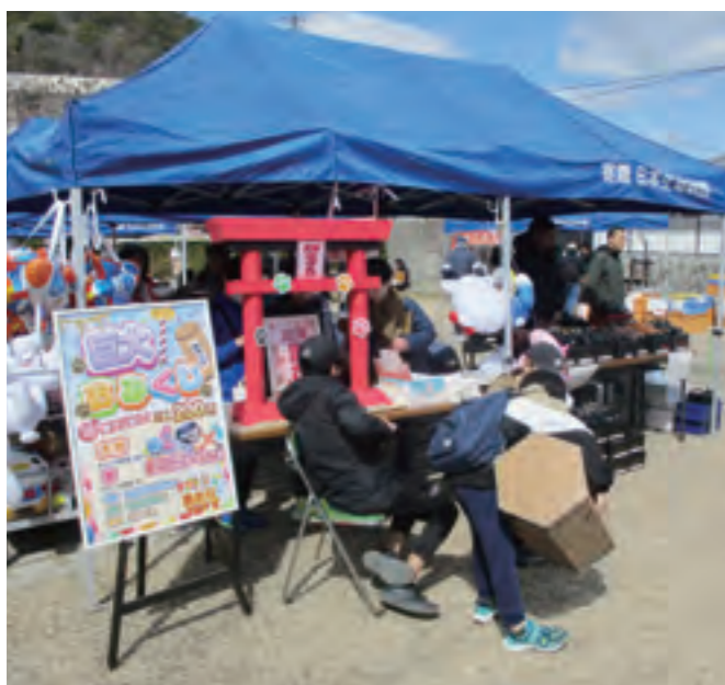
▲子供達によるボランティアのお店です